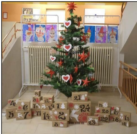
Adventný kalendár od deviatakov