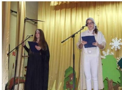
Zubatá a Perinbaba