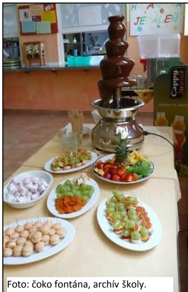
Foto: čoko fontána

nielen chutným obedom. Dozvedenia priatelia. –mi-