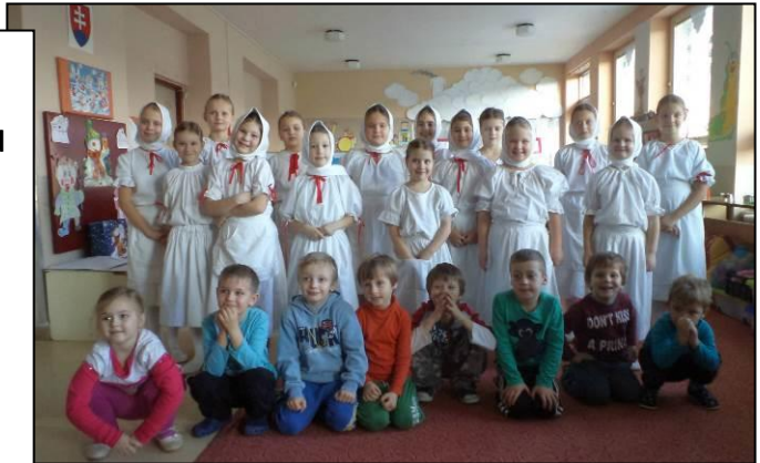
Studnička a škôlkári .

Zápis do 1. ročníka sa uskutoční dňa 2. februára 2015 od 10:00 do 16.00 h v triedach primárneho vzdelávania. Deti získajú množstvo zážitkov a darčiekov z významného dňa.