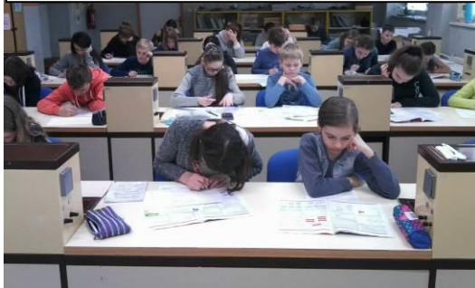
Žiaci úplne ponorení do riešenia úloh Klokana.

Spolu so žiakmi zo 60 krajín sveta sa zapojili do tejto medzinárodnej matematickej súťaže 20. marca 2017 aj naši matematici.