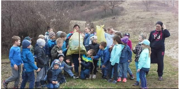
Množstvo odpadu zozbieraného okolo studničky a šťastné deti z ŠKD.

Po teoretických poznatkoch o význame vody, ktoré sa žiaci 1. stupňa dozvedeli z rozhlasovej relácie a od svojich pani vychovávateľiek v ŠKD, sa počas Dňa vody