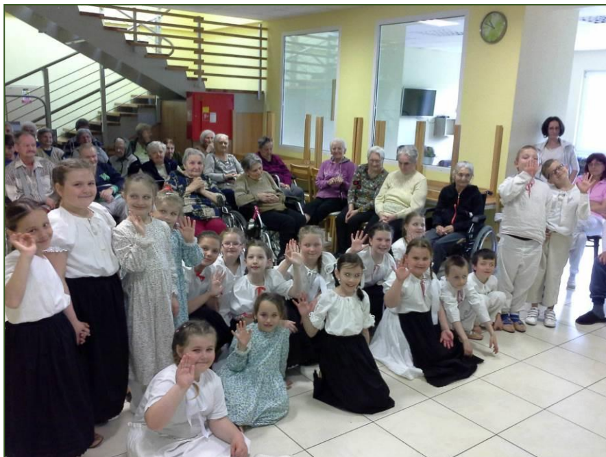
Z vystúpenia DFS Studnička pred Veľkou nocou v Seniore Banky.