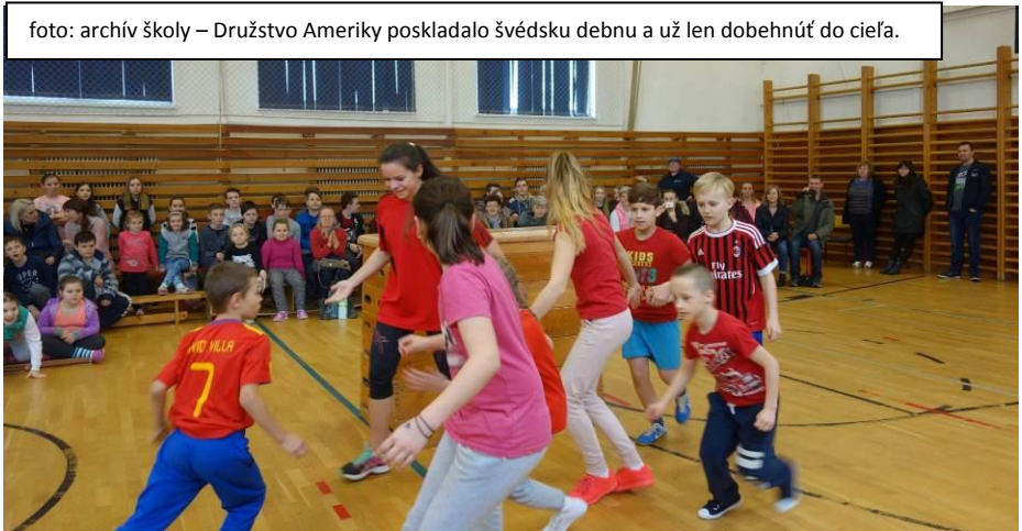
Družstvo Ameriky poskladalo švédsku debnu a už len dobehnúť do cieľa.

zapojili. Verím, že každý si so sebou odniesol nezabudnuteľný zážitok a pocit, že aj malé denné udalosti robia život veľkolepým. Športu zdar! – mv -