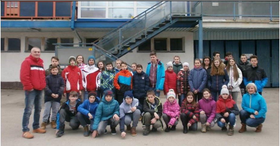
Skupina žiakov so svojimi inštruktormi pred ubytovňou Kopačka na Kubínskej holi.

Relax bol naplánovaný v miestnom aquaparku – Aquarelax, kde sa žiaci vyšantili. Lyžiarsky výcvik bol ukončený pretekom. Večer nasledovalo vyhodnotenie celého týždňa, zábavná časť Izba baví izbu a diskotéka. Cestou domov si žiaci prehladli miestnu dominantu – Oravský hrad. –tb-