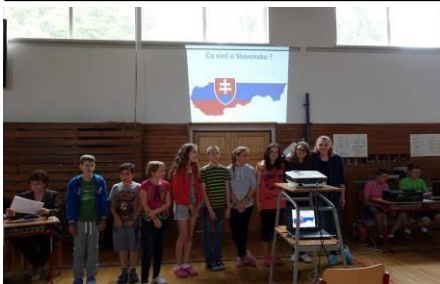
Víťazné družstvá – zľava V. A, VII. A, IX. A.

V školskom roku 2014/2015 si základná škola pripomína dve významné jubileá. 55. narodeniny otvorenia hlavnej budovy základnej školy a 20. výročie detského folklórneho súboru Studnička. Témy vedomostnej súťaže, ktorá je zameraná na poznávanie regionálnych a národných dejín, vyplynuli samovoľne z týchto výročí. Rok 2015 je rokom Ľ. Štúra. Celý rok v celej krajine sa upriamuje pozornosť na 200 – sté výročie narodenia Ľ. Štúra, preto aj jemu bol v súťaži venovaný priestor. Všetky súťažiace tímy boli skvelo pripravené. Porota a diváci mali možnosť sledovať množstvo správnych odpovedí. Len malé zaváhanie rozhodlo o poradí. Víťazné prvé miesto získala IX. A trieda, 2. miesto VII. A a na 3. mieste sa umiestnili naši najmladší súťažiaci z V. A triedy. Všetkým, ktorí sa podieľali na príprave a realizácii tejto súťaže, bolo vyslovené poďakovanie. –rr-