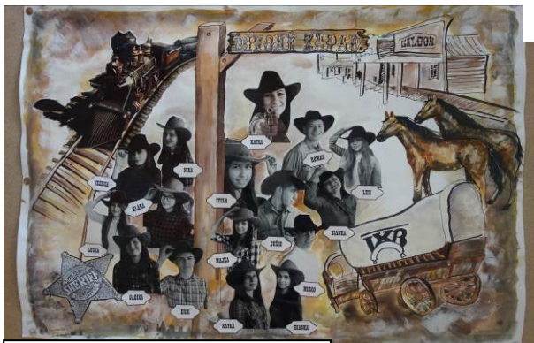
Tablo IX. B triedy. Foto: IX. B.