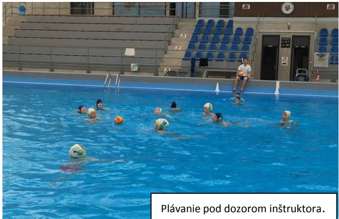
Plávanie pod dozorom inštruktora.

Inštruktori žiakov rozdelili do troch skupín podľa ich