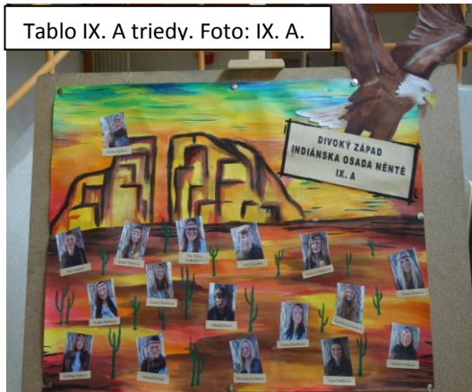
Tablo IX. A triedy. Foto: IX. A.

Inés nie je nikdy sýta, knihy ona rada číta. Písanie ju veľmi baví, atmosféru v triede spraví.