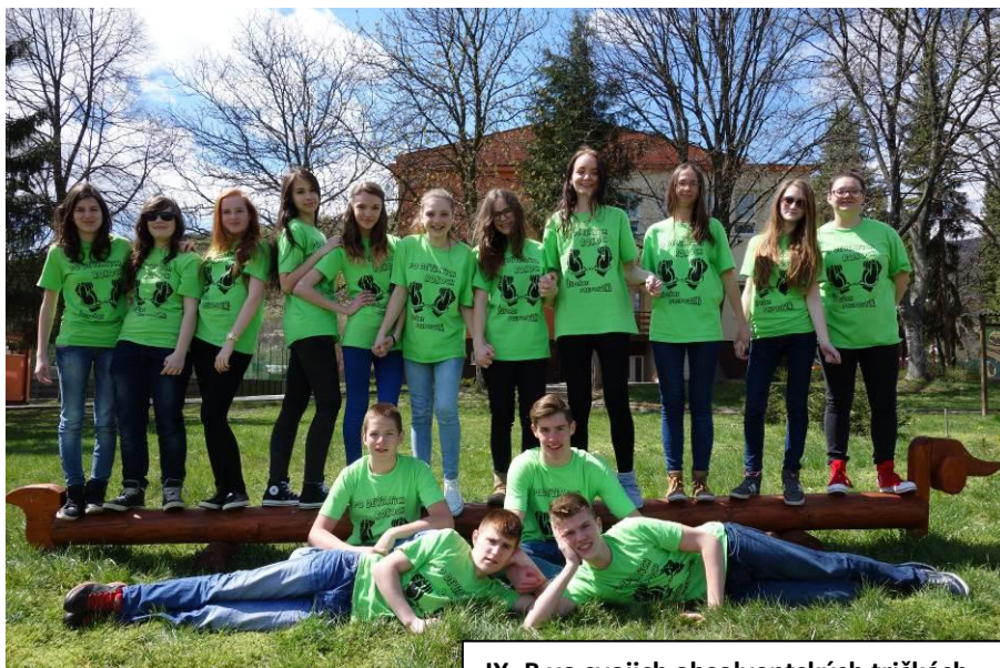
IX. B vo svojich absolventských tričkách.

Rozlúčková slávnosť deviatok sa uskutočnila 12. júna 2015 v Kultúrnom dome v Diviakoch nad Nitricou aj za prítomnosti rodičov, spojená so zápisom do Pamätnej knihy obce.