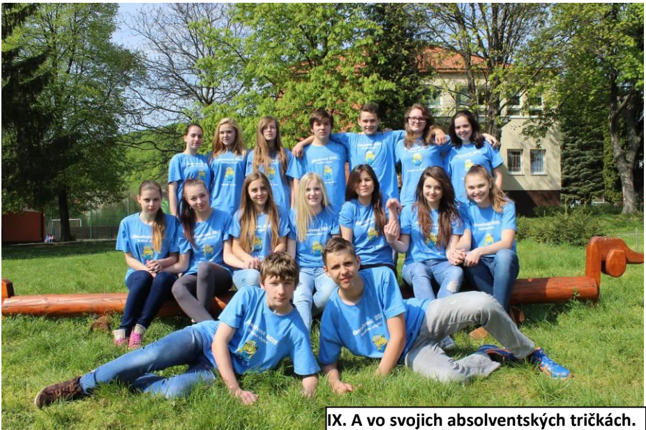
IX. A vo svojich absolventských tričkách.

Angličtinu obľubuje, a rýchlo v nej napreduje. Vždy nás všetkých pobaví, keď sa v triede objaví.