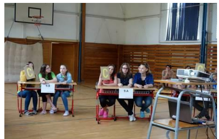
Súťažné družstvá – zľava IX. B, IX. A.